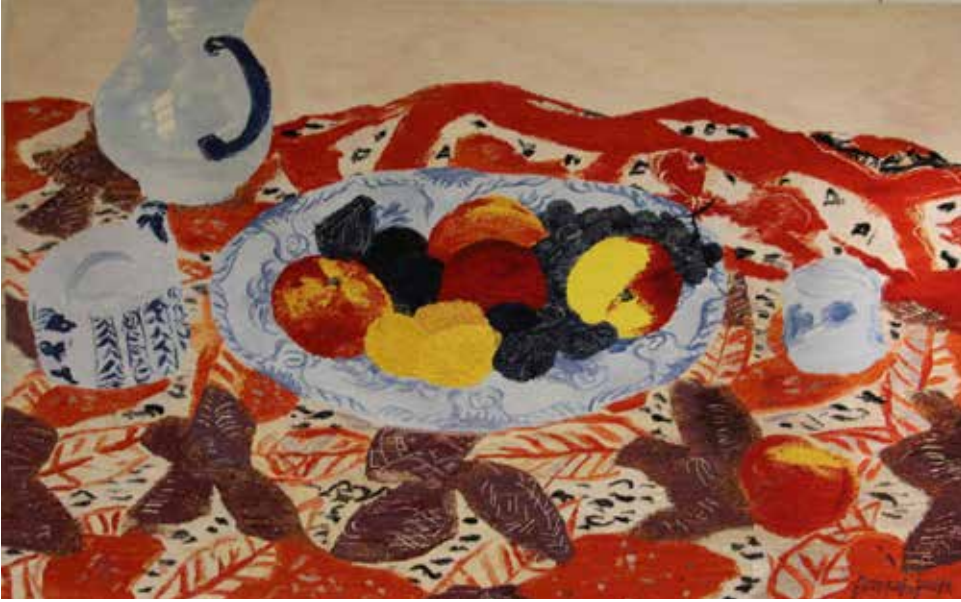
Coupe de fruits d'été - Boncompain