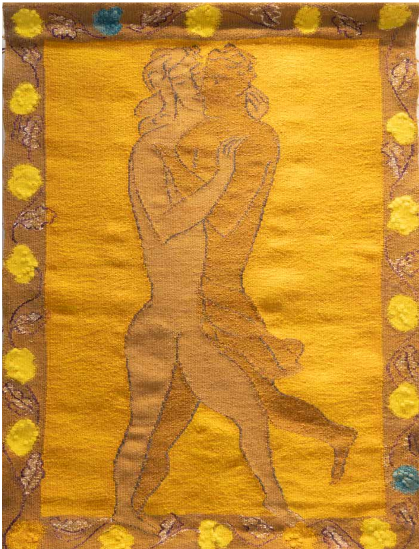
Cantique des Cantiques - Boncompain