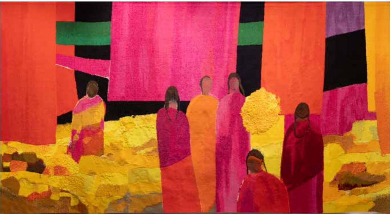
Le grand marché mexicain - Cathelin