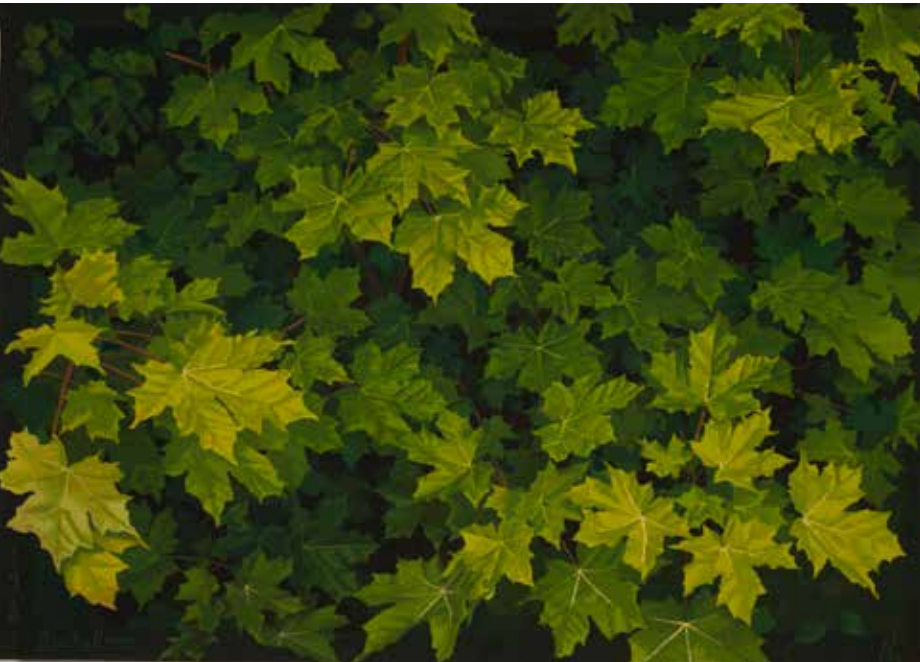
Feuilles d'érables - Bachellerie