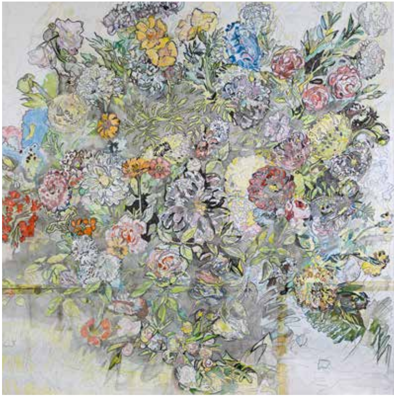
Delacroix - Bachelierie