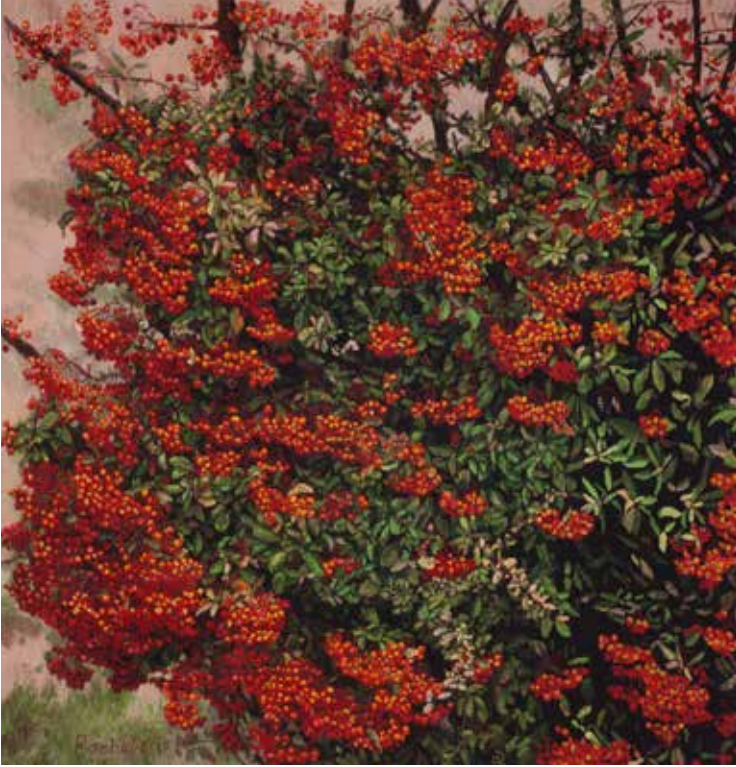
Pyracantha - Bachellerie