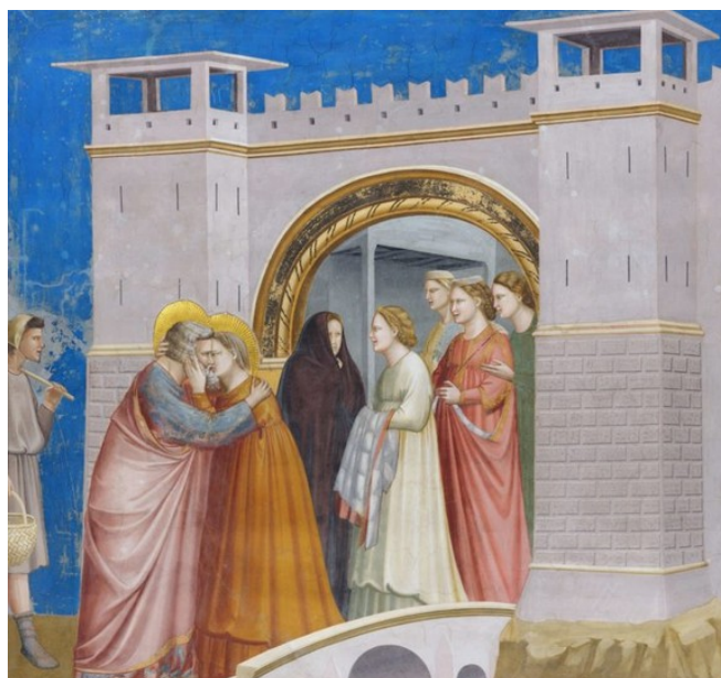
Giotto, Rendez-vous à la porte Dorée , Chapelle des Scrovegni, fresque, 200 x 185 cm, 1305.

Vierge Marie, Sainte Anne et Saint Joachim, s'embrassant aux portes de Jérusalem. C'est ce motif du baiser aux portes d'une ville qui fait écho au dessin de Nava, pour qui cette embrassade à l'entrée de la ville permet de « faire ville ». Épuré de son programme à l'origine religieux, il met en scène un couple de personnages aux traits universels, dont le point de contact est la maquette de cette cité nichée au creux de la main d'un de ces acteurs du vivre ensemble.