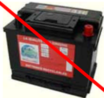
Batteries au plomb et à l'acide (batterie de voiture ou de moto)