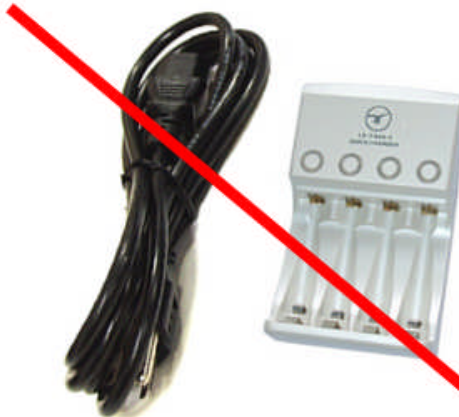
Chargeur pour pile rechargeables ou chargeur d'accumulateur