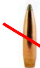
Cartouches ou douille de fusil