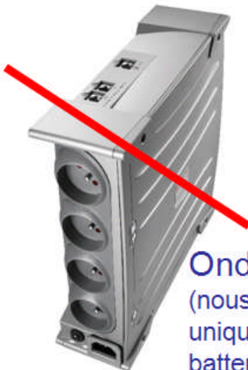
Onduleur (nous prenons uniquement la batterie)